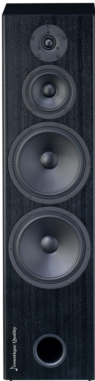
29 Mk III

Jistý vývoj zaznamenala kromě výhybky i konstrukce vnitřní kabeláže. Na tu bych rád upozornil především proto, že kvalitní kabel k reprosoustavám je obvykle dáván za naprostý základ audiofilům, kteří třeba nemají hluboko do kapsy a každý kvalitativní, i zlomkový posun je pro ně zásadní. Často jsou jim však