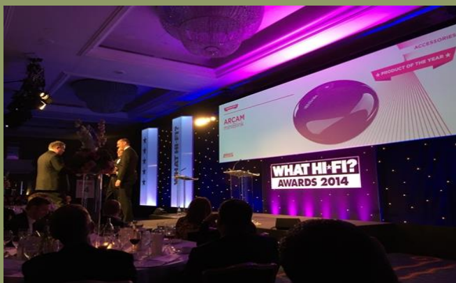
Předávání cen časopisu WHAT HI-FI?

Rok 2014 byl pro Arcam velmi úspěšným. V kategorii výrobek roku, vyhlašované prestižním časopisem WHAT HI-FI?, získal hned tři ocenění.