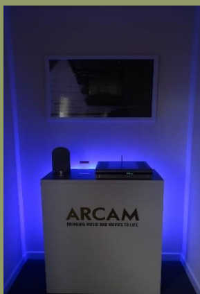
Před poslechovou místností

Tři dny, které jsme strávili ve Velké Británii na návštěvě ve vývojovém středisku ARCAM, byly plné nových vjemů, informací a zkušeností. Dá se říct, že zcela zásadním způsobem ovlivnily naše vnímání značky a její pozice na trhu. Atmosféra, která vládne na pracovišti je velmi nakažlivá a v našich poměrech nezvyklá. Výsledky pak stojí za to.