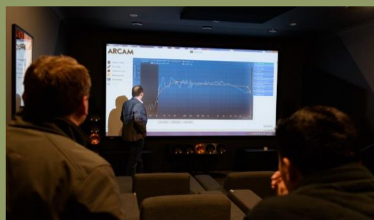
Prezentace schopností DIRAC LIVE