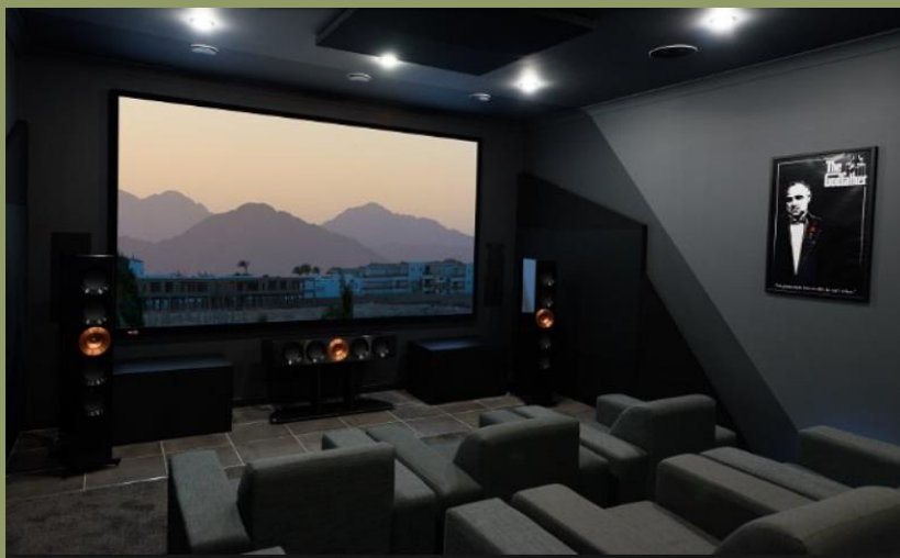
Poslechová místnost pro domácí kino ARCAM