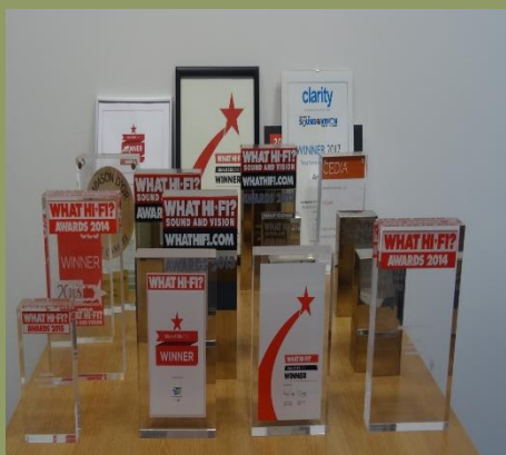
Ocenění vystavená ve vývojovém centru

“...ve své krvi máme těžce vydobité postupy pro zachování a zpracování nejcitlivějších signálů v reprodukci hudby, s veškerou jejich jemností, nuancemi a vzrušením. Víme, že se audio přesouvá z CD disků k vyšším definicím formátů a jsme přesvědčeni, že naše produkty budou vždy věrně sloužit hudbě a nadále přinášet maximální potěšení posluchačům.