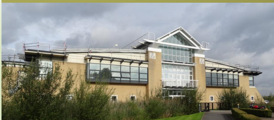
Sídlo společnosti ARCAM v Cambridge